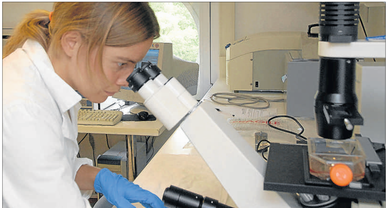
El rico entorno de investigación académica de Trento ha propiciado el nacimiento de varias empresas